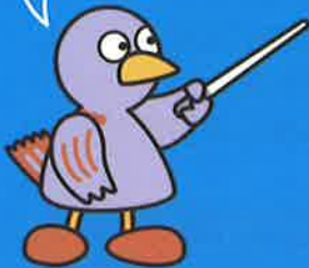
埼玉県のマスコット「コバトン」