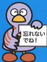
埼玉県のマスコット 「コバトン」